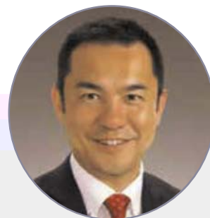
三重県知事 鈴木 英敬