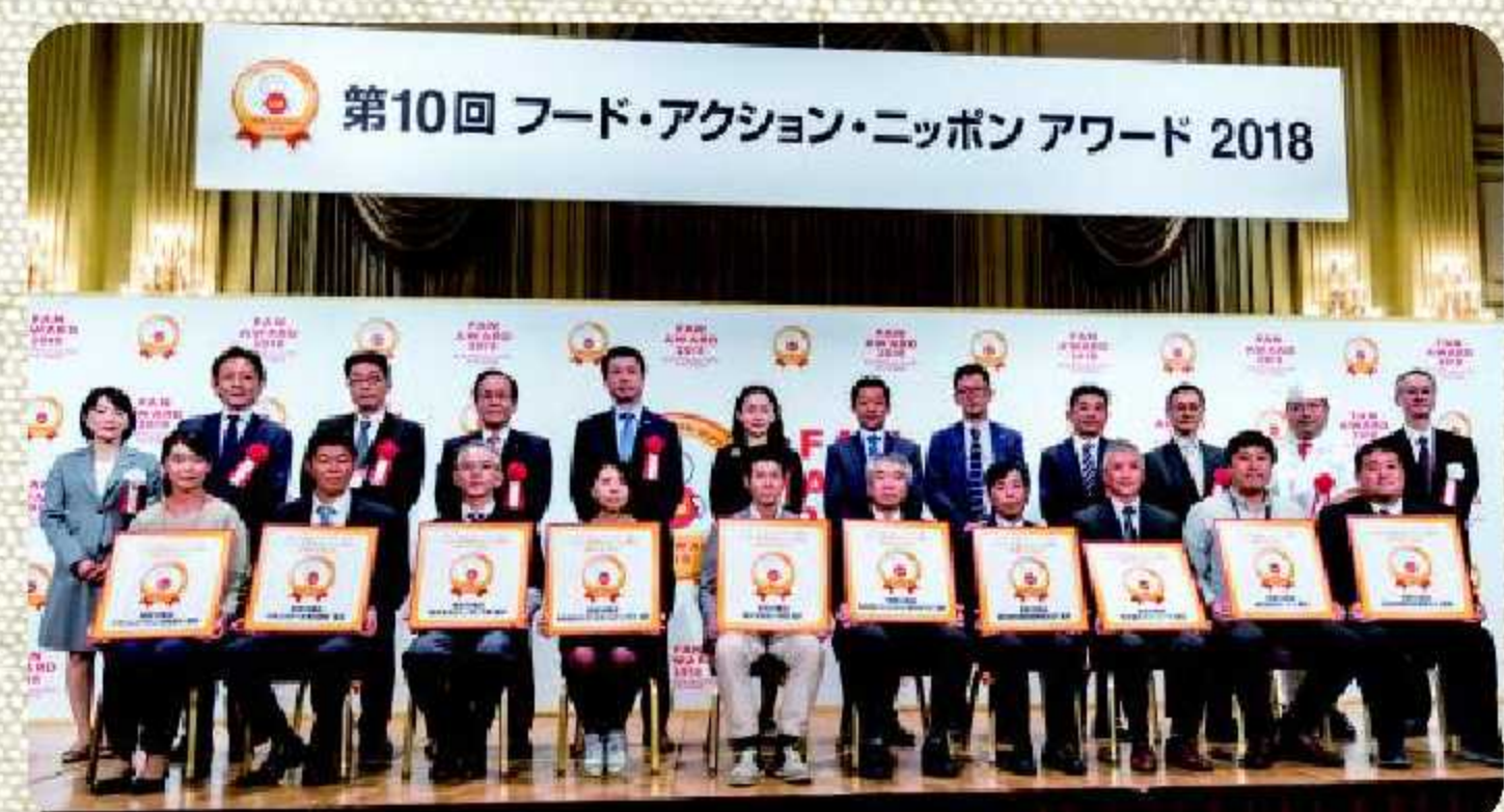
※昨年会場イメージ