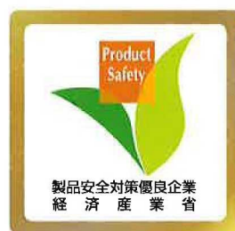
製品安全対策ゴールド企業 ロゴマーク