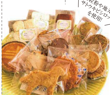
全粒粉や地元産サトウキビシロップを使用!