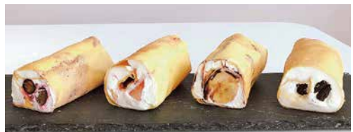
【志摩市】 Ricca Ricca (リッカリッカ) ◎米粉のミニクレープ ミックスフルーツ・クッキーカスタード・バナナチョコ・イチゴ・マロン 1個 324円 ◎伊勢志摩のクッキー缶 32枚入 3,240円