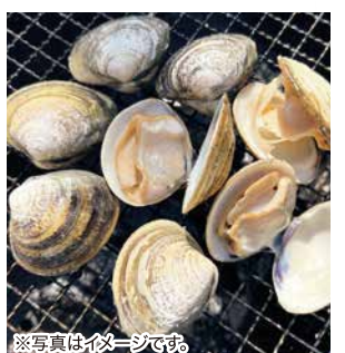
【四日市市】 東海水産 畜養はまぐり(中国産) 1,000円 Lサイズ 1ネット700g(12~13個入)