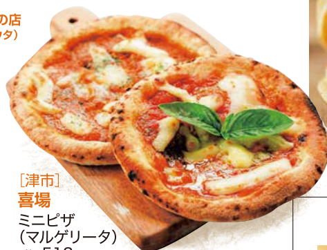
【津市】 喜場 ミニピザ(マルゲリータ) 1枚 518円

主催：三重県商工会連合会 令和5年度伴走型小規模事業者支援推進事業(実施商工会) 桑名三川・いなべ市・菰野町・桶町・朝明・津北・津市・伊賀市・松阪北部・松阪香肌・多気町・大台町・大紀町・南伊勢町・志摩市・みえ熊野古道・紀宝町