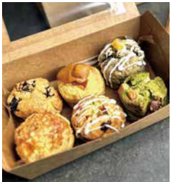
【いなべ市】 Anniversary Café (アニバーサリーカフェ) 6種スコーンセット 1箱 900円