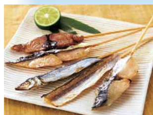
【南伊勢町】 山藤 焼き串ひもの各種 2本入 432円