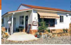
【志摩市】 Maki's Bakery (マキスベーカリー) シュトーレン 各2,457円 ナチュラル・ショコラ 280g

フランスで修行し、フランスの製パン国家資格を取得した店主が作る本場の味。クリスマスまで待ちながら少しずつ切り分けて食べるドイツの伝統菓子「シュトーレン」の変化していく味をお楽しみください。