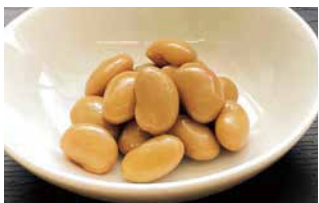
【松阪市】 権現前営農組合 嬉野大豆のピクルス 100g 648円