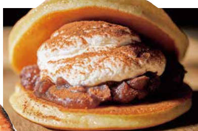
【いなべ市】 いなべ菓子店 八舎 どら焼き各種 1個 220円から