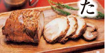
【川越町】 荒木園一商店 ◎つくだ煮屋のたまり又焼 350g 3,024円【各日限定数30】 ◎つくだ煮屋の手羽先 4本入 1,080円【各日限定数30】