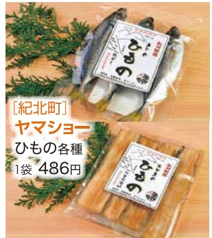
【紀北町】 ヤマショー ひもの各種 1袋 486円