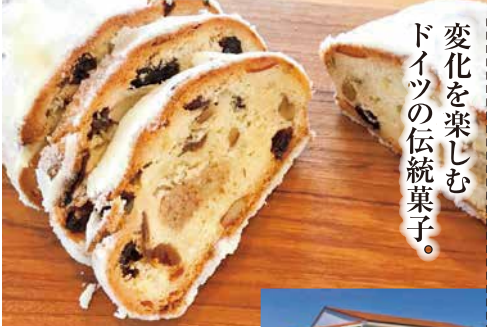
変化を楽しむ ドイツの伝統菓子。

フランスで修行し、フランスの製パン国家資格を取得した店主が作る本場の味。クリスマスまで待ちながら少しずつ切り分けて食べるドイツの伝統菓子「シュトーレン」の変化していく味をお楽しみください。