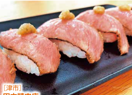
【津市】 田中精肉店 物産展限定 松阪牛ローストビーフ肉寿司 5カン 2,138円 ※11/29(水)・12/2(土)・3(日)のみ出品

お肉博士監修の肉寿司。 創業68年の松阪牛黒毛和牛専門店「田中精肉店」が厳選した松阪牛を、全国食肉検定委員会主催の「お肉検定1級」に合格したお肉博士が監修して、希少なイチボを使ったローストビーフのお寿司を作りました。