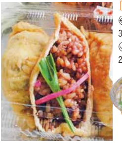
【菰野町】 菰山亭 ◎酵素玄米いなりずし 3個入 450円 ◎長岡式酵素玄米 200g 648円