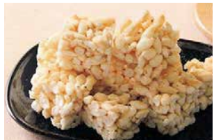
【桑名市】 車久米穀店 多度ばっかん 80g 378円