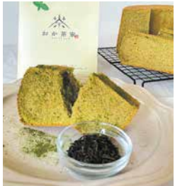
【いなべ市】 あさのさんちのおやつ 石樽茶シフォン 1個 238円