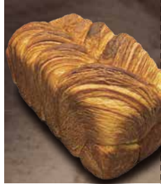
【いなべ市】 洋食屋SAKURA・松ぼん クロワッサン食ぱん 1個 1,296円【数量限定】