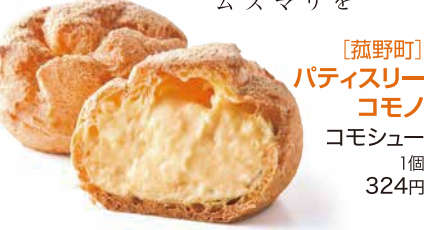
【菰野町】 パティスリー コモノ コモシュー 1個 324円

サククリ生地にとっぷりクリーム。北海道産の発酵バターを使った風味豊かなサククリとした生地に、最高級のマダガスカル産パナレーゼンズを使ったカスタードクリームをたっぷり詰めました。