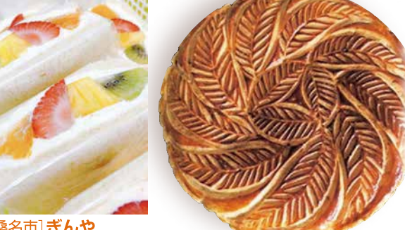
【津市】 Atelier petit à petit (アトリエプチアプチ) ガレットデロワ 1カット 432円 ※11/29(水)・12/2(土)・3(日)のみ出品