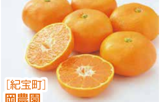
【紀宝町】 岡農園 紀宝町産 温州みかん 12~16個(1kg) 700円