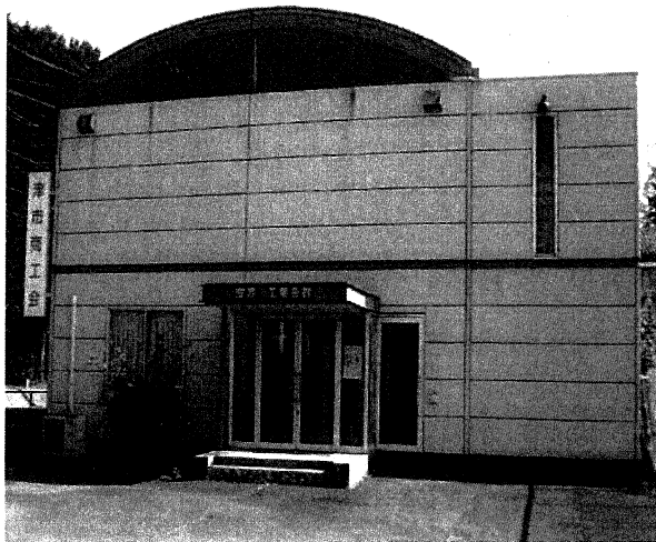
(写真) 安濃工業会館正面