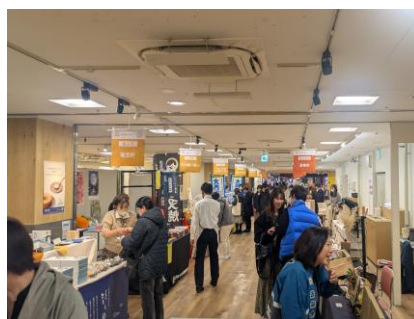
選定品販売 イベント