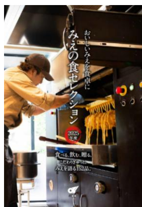
カタログの作成 県政だより等への掲載